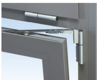
Uni-Jet C Петлевая сторона