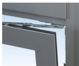
Uni-Jet C-CONCEALED Петлевая сторона

Данная фурнитура базируется на испытанном, модулярном центральном запирании UNI-JET с самонастраивающимся Cleverte грибовидным роликом. Новинка-это защёлкивающаяся фурнитура с полностью скрытыми опорой ножниц и нижней опорой для алюминиевых окон со створочным пазом 16 мм.