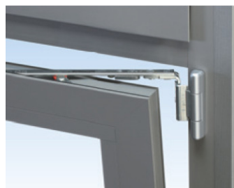
Uni-Jet D Петлевая сторона

Новинка в алюминиевых окнах: дополнительно к классической наружной „D“ и „C“ петлевой стороне добавилась полностью скрытая петлевая сторона UNI-JET C-CONCEALED.