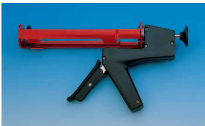
Пистолет для силикона H14 / 310 мл