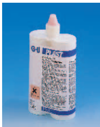
G.U-PLAST 2-х компонентный клей