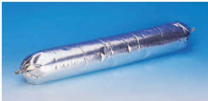
Упаковка 600 мл для силикона Sealant и универсального, предлагается как экономичная и экологичная альтернатива.