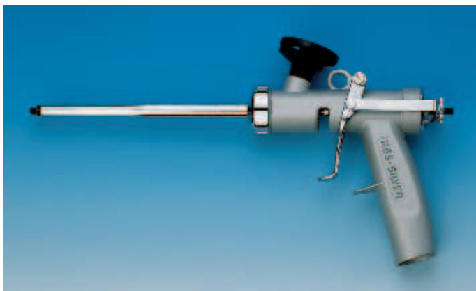
Пистолет для пены NBS-Silver