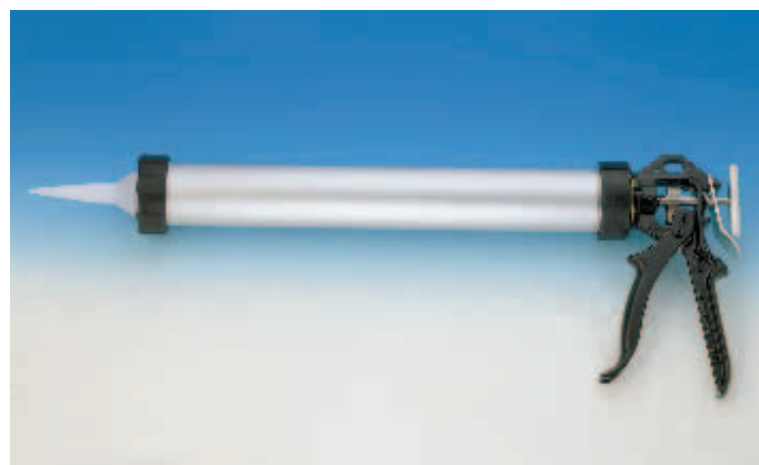
Пистолет для силикона H17 / 600 мл