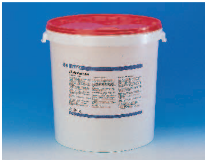
G.U-PLAST D3-Клей, G.U-PLAST D4-Клей