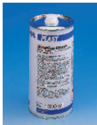
G.U-PLAST Очиститель для алюминия

Быстро высыхает на окрашенных и анодированных профилях.