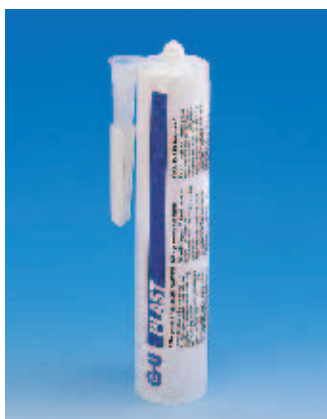
G.U-PLAST 1 компонентный клей