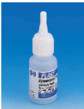
G.U-Клей «секунда» 1-компонентный

Для быстрого склеивания элементов из ПВХ, например: – для ставней – отделочных профилей – элементов роллет и т.д. – содержит ультрафиолетовые стабилизаторы