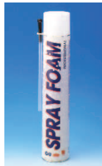
РУЧНАЯ ПЕНА / зимняя