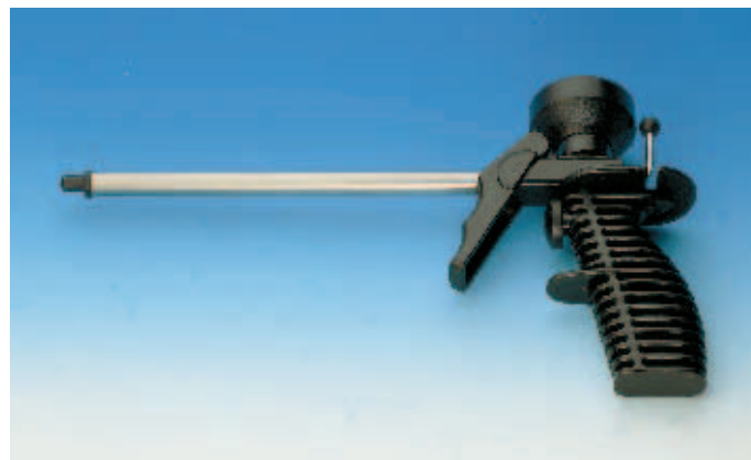
Пистолет для пены Ultra