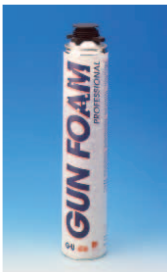
ПИСТОЛ. ПЕНА / зимняя

Поверхность перед нанесением очистить, обезжирить и увлажнить.